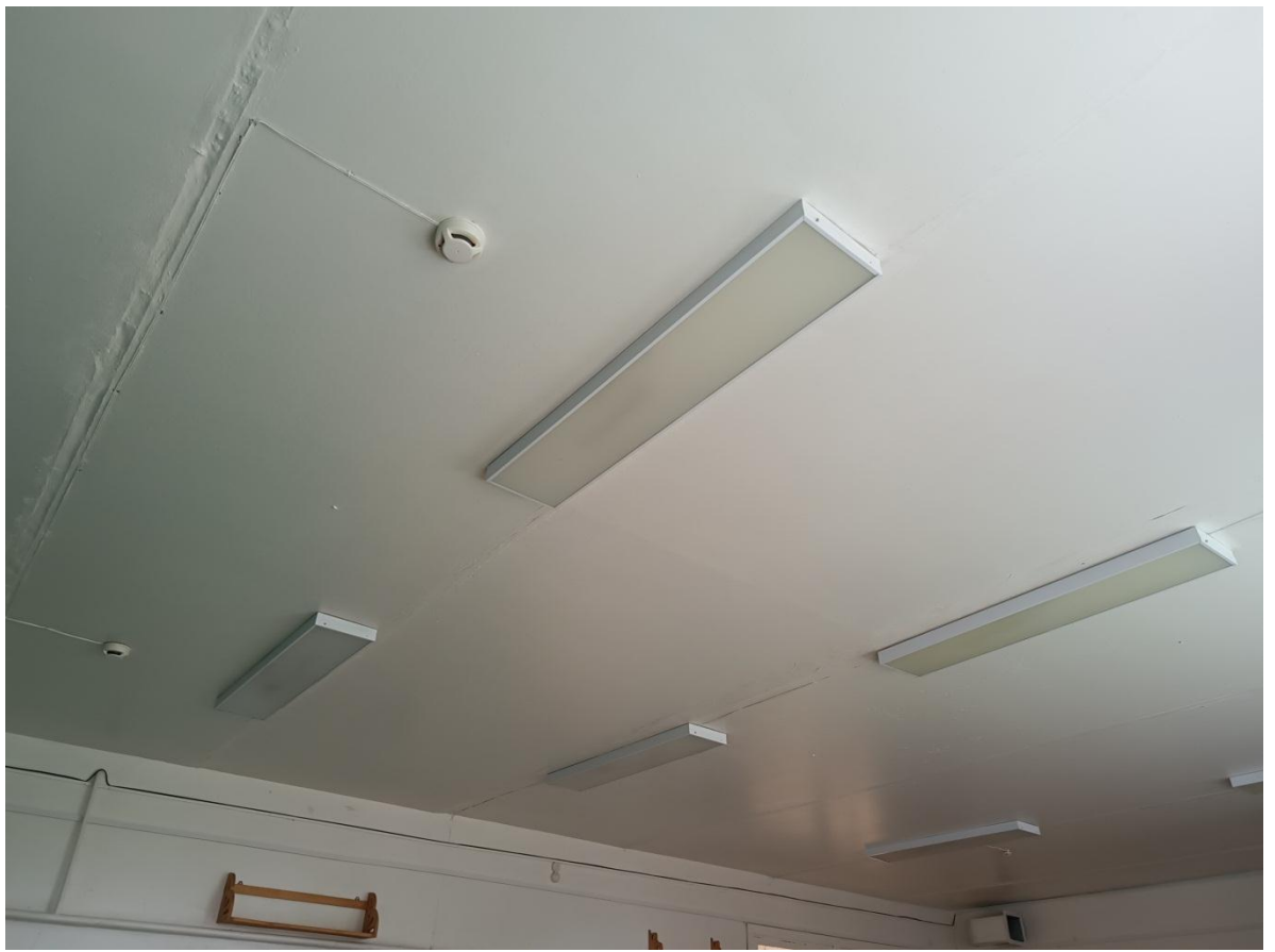
Кабинет русского языка и литературы