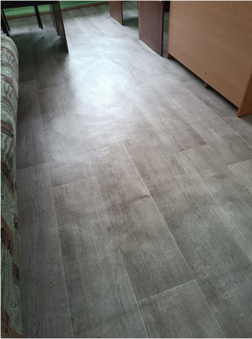
Кабинет № 31