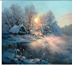
М. А. Иваненко «Там, где сбываются мечты»